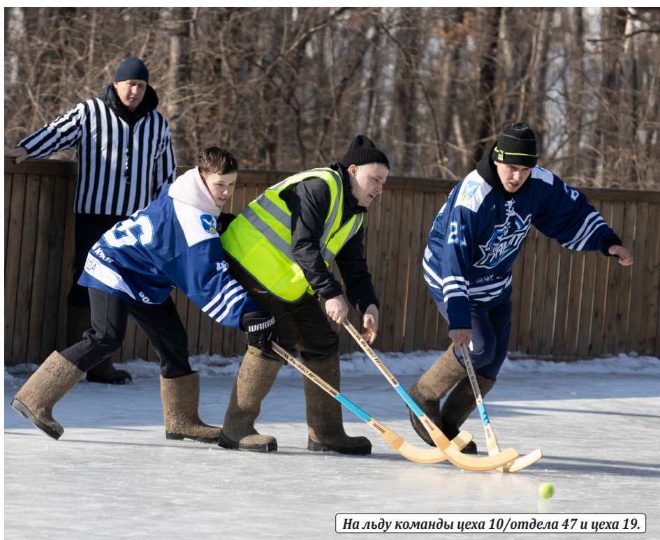
На льду команды цеха 10/отдела 47 и цеха 19.