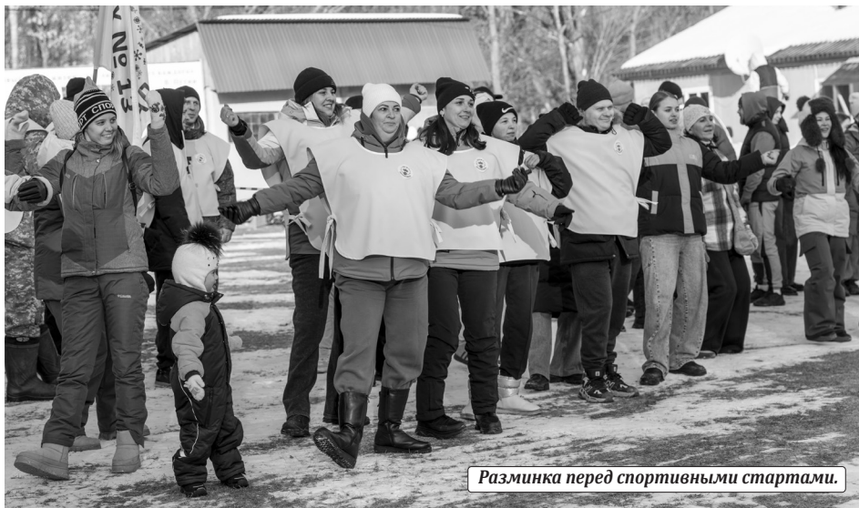
Разминка перед спортивными стартами.