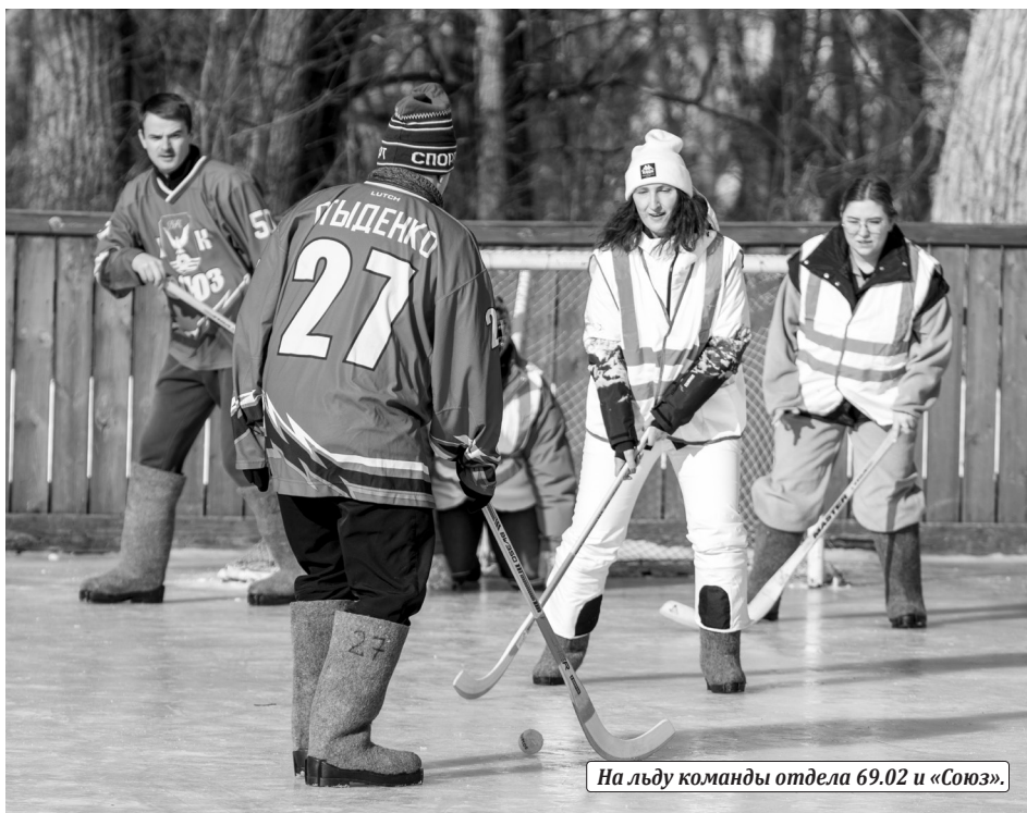
На льду команды отдела 69.02 и «Союз».