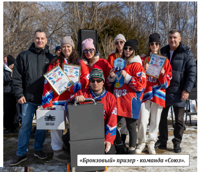
«Бронзовый» призер - команда «Союз».