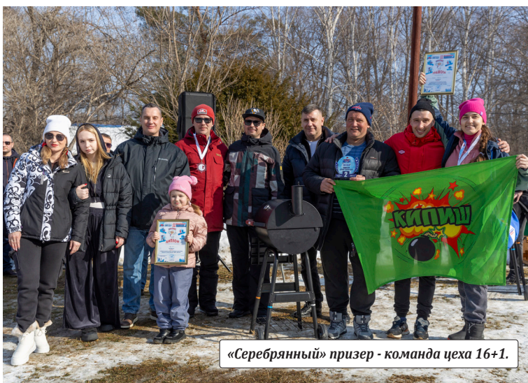
«Серебряный» призер - команда цеха 16+1.