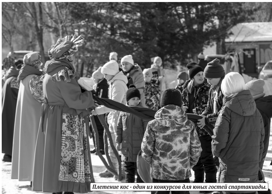
Плетение кос - один из конкурсов для юных гостей спартакиады.