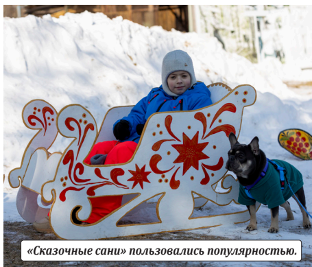
«Сказочные сани» пользовались популярностью.