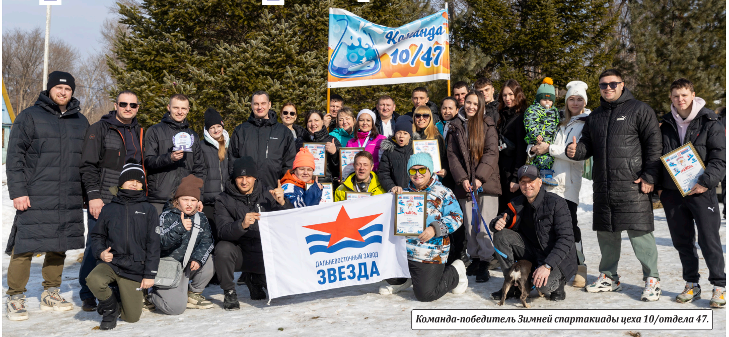
Команда-победитель Зимней спартакиады цеха 10/отдела 47.